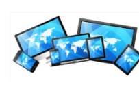
Multiplataforma y responsive