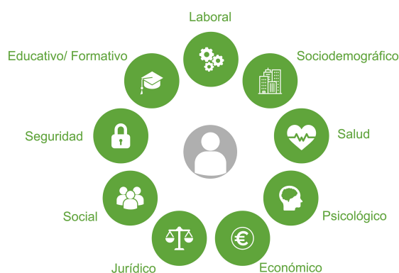
FICHA DE LA PERSONA USUARIA

Incorpora la Ficha de la Persona Usuaría (FPU) como elemento que recoge todos los datos de la persona estructurada en esferas, pestañas y grupos de datos. Cada grupo de datos puede contener además de la información específica, documentación acreditativa, notas y avisos, así como notificaciones.