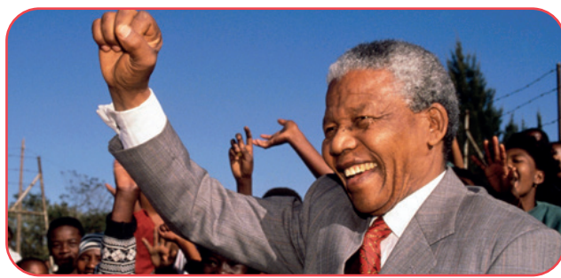
Presidente electo de Sudáfrica (1994)