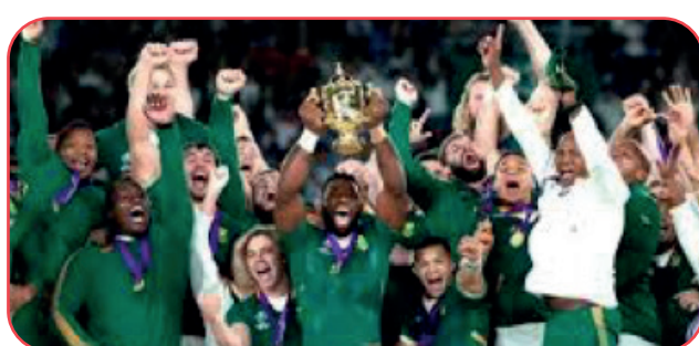
Une a una nación a través del deporte (1995)