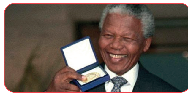
Recoge el premio Nobel de la Paz (1993)