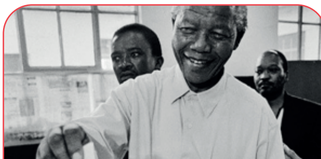
Mandela emite su voto (1994)