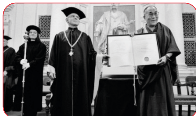
Su Santidad el Dalái Lama recibe el Premio de Derechos Humanos de la Universidad de Graz en Graz, Austria, el 14 de octubre de 2002.