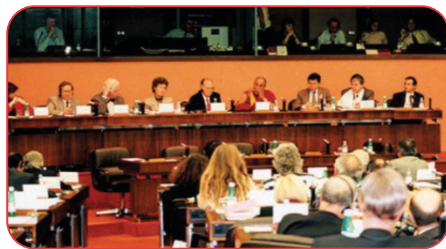
Su Santidad el Dalái Lama dirigiéndose al Parlamento Europeo en relación al Plan de Paz de cinco puntos en Estrasburgo, Francia, el 15 de junio de 1998.