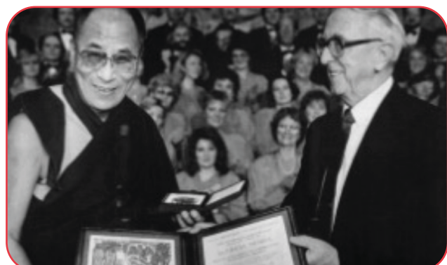
Su Santidad el Dalái Lama Recibiendo el premio Nobel de la Paz, 1989.