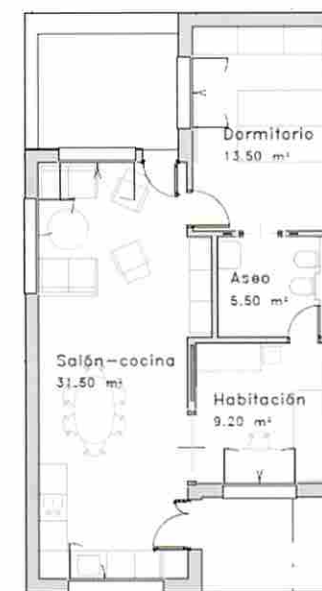
Unidad residencial tipo 2 dormitorios

En las zonas de convivencia estarán las instalaciones comunes (comedor, cocina, sala de estar y espacios multiusos como área de descanso y visitas, huerto, etc), servicios técnicos y sanitarios auxiliares.